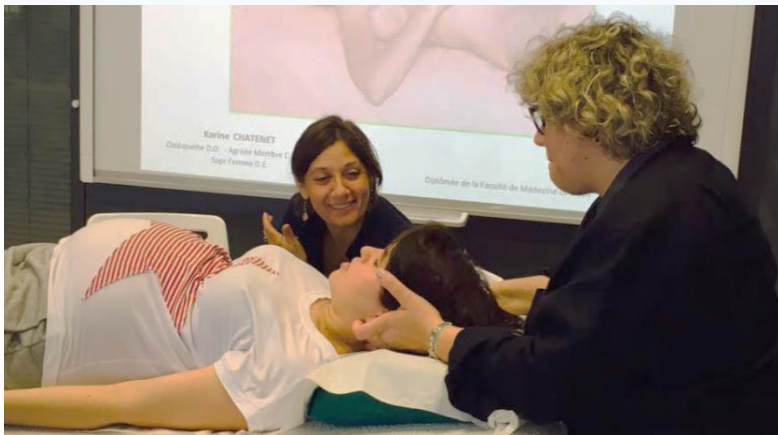
Tutorial clinico durante il primo corso a Torino